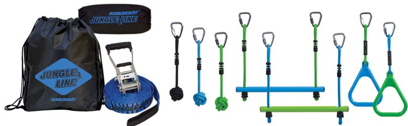
Das „Jungle Line“-Set und die „Allround-Slackline“ machen den Garten oder Park zum Hindernisparcours

D ie neue „Schildkröt Jungle Line“ ist die Innovation für den Bereich Garten-/Bewegungsspiele schlechthin. Die „Jungle Line“ (sehr ähnlich einer Slackline) für Kinder ab 5 Jahren ist 11 m lang (9 m nutzbar) und 5 cm breit. Enthalten sind Gymnastikringe, Holz-Sprossen (Affenschaukeln) und Affenfäuste. Der komplette Lieferumfang kann in die enthaltene Nylon-Tasche gepackt werden. Die maximale Belastbarkeit beläuft sich auf 120 kg.